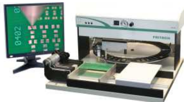
Manipulateur Fritsch LM équipé vidéo VS 927