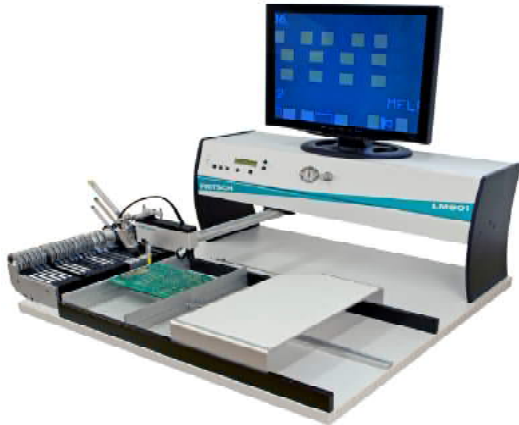
Manipulateur Fritsch LM901 équipé vidéo VS 927