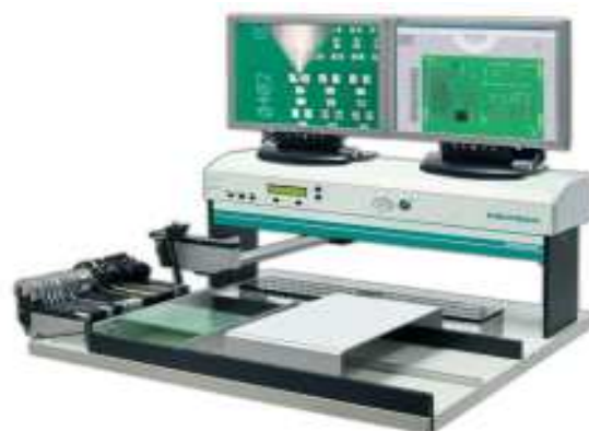
Manipulateur Fritsch SM equipé vidéo VS 927