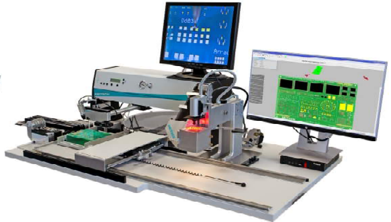
Manipulateur Fritsch MP904 équipé vidéo VS 927