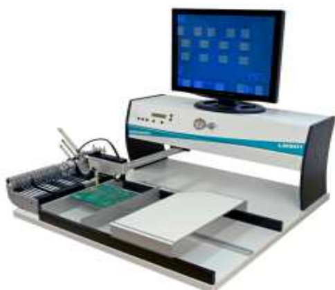
Manipulateur Fritsch LM e quipé vidéo VS 927